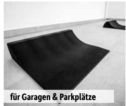
für Garagen & Parkplätze

Die Oberflächen- und Umgebungstemperatur muss mind. 5°C betragen. Die Elemente sollten ausschließlich bei trockenem Wetter verklebt werden. Klebekartuschen dürfen nicht unter 10°C gelagert werden.